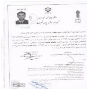
تصویر مدارک تحصیلی