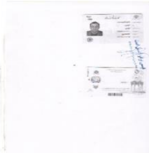
تصویر کارت ملی